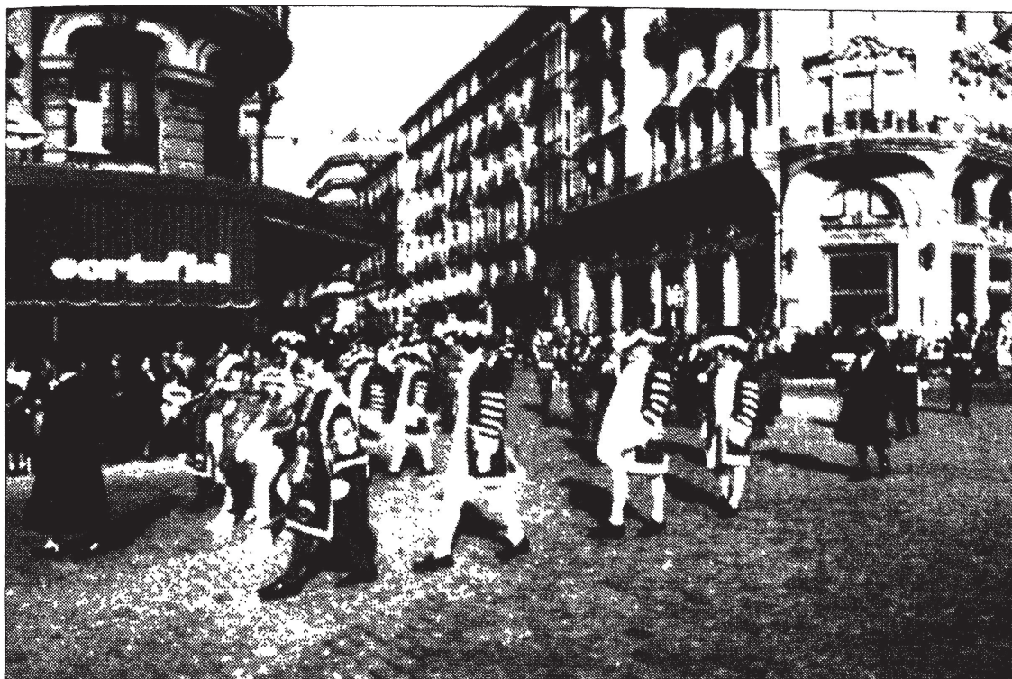
FIG. 1.—Comitiva cívica que recorre el centro de Granada cada 2 de enero.