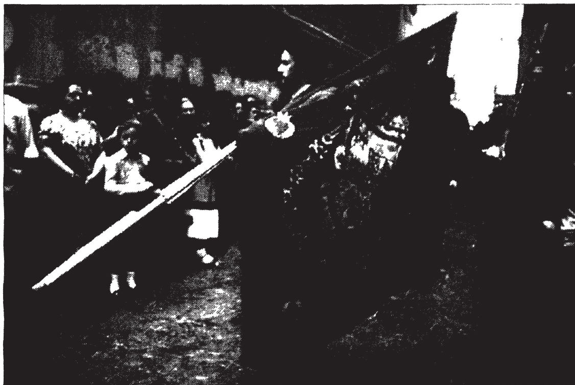
FIG. 2.—El pendón de la ciudad es el mayor protagonista simbólico de los actos.