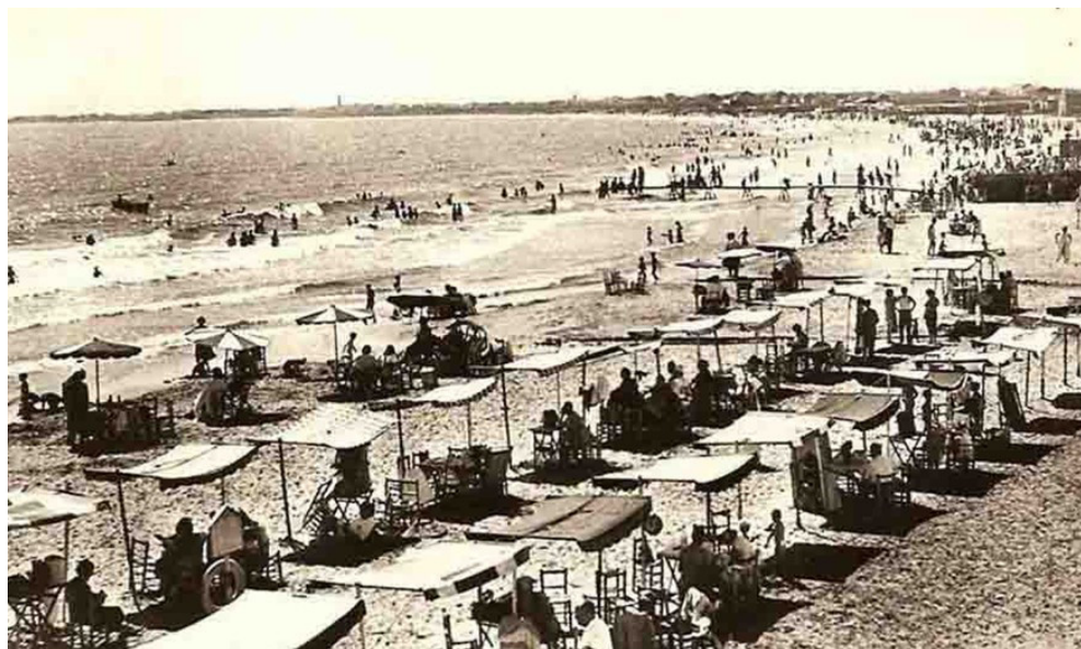
IMAGEN 2.—La playa de Nazaret a principios del siglo XX.

can de manera notable el espacio litoral urbano de Valencia: la expansión imparable del puerto, a la que se supedita la calidad y el crecimiento del hábitat; la industrialización de la zona, ya iniciada en el periodo anterior y que avanza ahora a marchas forzadas; la llegada de sucesivas oleadas de inmigrantes internos que ocupan viviendas precarias. El impacto conjunto de todo esto es especialmente notable en Nazaret. En efecto, durante la postguerra su población creció de manera notable debido al alud de inmigrantes que construyeron chabolas y casas precarias junto a la línea de playa o incluso dentro del mismo cauce del río, hasta que se las llevó la riada de 1949. De este modo, algunos mallorquines pero sobre todo castellanos y andaluces se suman al núcleo de original de pobladores del barrio, integrado por labradores, pescadores, trabajadores portuarios y también algunas familias vinculadas a la explotación turística de la playa.