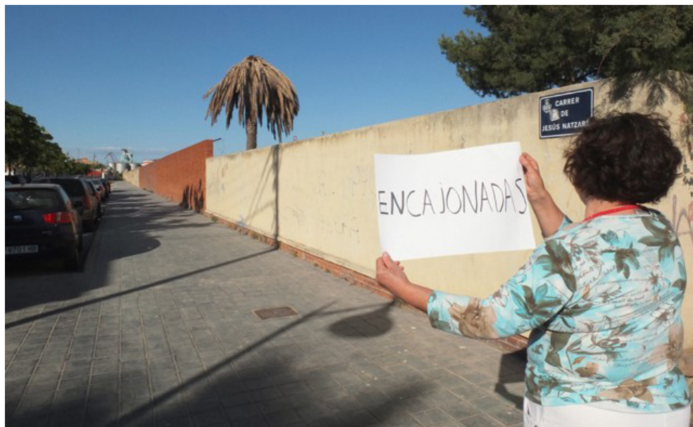
IMAGEN 3.—Sensaciones que provoca el muro que separa de forma tajante Nazaret y el mar.

sucede en sus respectivos conjuntos urbanos. Por un lado, la sensación de abandono, pérdida e indefensión que experimentan sus vecinos y vecinas en todo lo que respecta a la actuación de las administraciones públicas y la dotación de equipamientos y servicios públicos. Por otro, las tendencias evolutivas de las redes interpersonales y de la participación asociativa, que se debilitan y adelgazan a medida que se consolidan los procesos sociopolíticos de la transición política. Durante los últimos años del franquismo había en todas estas zonas, Nazaret incluida, un movimiento vecinal muy activo que alimentaba pautas de solidaridad, confianza y reciprocidad muy sólidas y eficaces; en contraste, en la década siguiente (años ochenta) la lucha vecinal se ralentiza, al tiempo que las redes interpersonales se descarnan y problematizan, al experimentar las dramáticas consecuencias del paro, la droga y el aumento de la delincuencia.