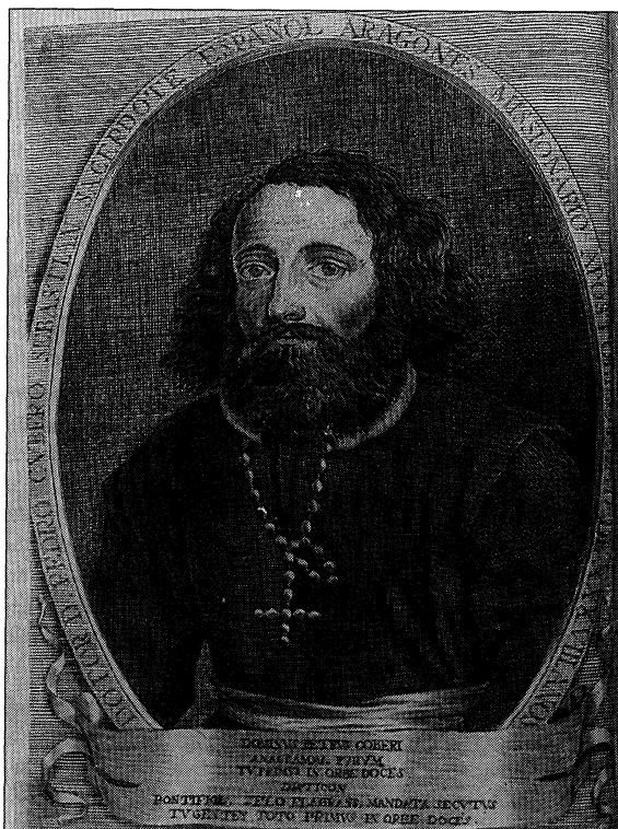
FIGURA 1.—Retrato del P. Cubero ( Peregrinación del Mundo , Nápoles, 1682).

(Nápoles: Salvador Costaldo, 1684), luego vertida al italiano por D. Francisco de la Serna (Nápoles: Carlos Porsile, 1685). 3) Segunda peregrinación donde se refieren los sucesos más memorables assí de las guerras de Ungría, en el Assedio de Buda, Batalla de Arsau, y otras: como en los ultimos tumultos de Ingalaterra... , etc. (Valencia: Iayme de Bordazar, 1697). Menciona también la Descripción general del mundo y notables sucesos que han sucedido en él, con la armonía de sus tiempos, ritos, ceremonias costumbres y trages de sus naciones, y varones ilustres que en él ha avido , por haberla anunciado el propio autor al fin de la Segunda peregrinación como de publicación inminente en Valencia, donde en efecto la imprimió Vicente Cabrera el mismo año de 1697. Latassa no llegó, pues, a verla, y no se sabe en qué se funda para decir que «es obra distinta de la referida en el número 2». Las ediciones napolitanas del núm. 1, en castellano (1682) e italiano (1683) llevan un retrato del P. Cubero, obra de A. Portio.