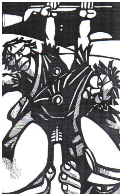
Extraído do cordel Os Irmãos Piriá , p. 39.

Voltemos à imagem dos dióscures do mito de Apolo. Tal como os dois irmãos gregos Eurytos e Kreatos, Sebastião e Orlando constituem manifestações diferentes de uma mesma força ou de um mesmo ser 43 . Apesar de terem direito cada qual a